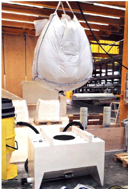
1 Die neue Big Bag hilft für ein kräftesparendes Füllen.

Wo früher noch mit Hand gearbeitet wurde helfen heutzutage Maschinen. Waren sie anfangs noch schwer und unhandlich hat sich das heute verbessert. Die flexiblen Geräte sind kompakt. Doch zuvor müssen sie befüllt werden. Stuckateure können sich nun bei dem Gebinde zur Materialbeschickung ihrer Maschinenteknik eine innovative Möglichkeit wählen. Hersteller Inotec hat eine Variante auf den Markt gebracht: Mit der neuen Big-Bag-Box Mono können 230 V- und 400 V-Mischpumpen jetzt auch mit Material aus Big-Bags befüllt werden. Ober- und Strukturputze, WDVS-Kleber, Armierungsmörtel, Bodenspachtelmassen, Fließestrich gehören dazu. Die Füllmenge eines Big-Bags beträgt bis zu einer Tonne, was in etwa einer Europalette mit 40 Materialsäcken entspricht. Durch den Einsatz der neuen Big-Bag-Box Mono entfällt für die Mitarbeiter das mühsame Schleppen und Heben der schweren Säcke und die händische Befüllung der Mischpumpe mit Muskelkraft genauso wie Logistik-, Miet- und Reinigungsgebühren für das Aufstellen und die Benutzung von Silos. Außerdem ist ein nahezu staubfreies Arbeiten möglich, da die Big-Bag-Box Mono mit einem Ansaugstutzen ausgestattet ist, an den ein entsprechender Industriestaubsauger an-