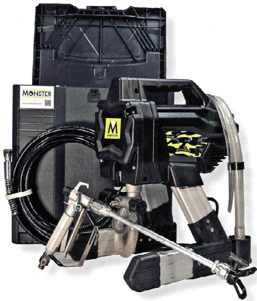
7 Bei Monster EasySpray 1.5 garantiert die Easy-Drucksteuerung für ein exaktes Spritzbild.