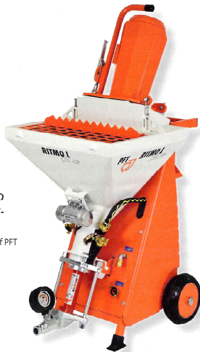
4 Die einfache Bedienung erleichtert den Alltag.