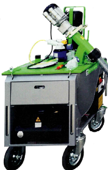
2 Das neue Big-Bag-Befüllsystem für Mischpumpen besteht aus der Mischpumpe Picco Power (230 V) oder Maxi Power (400 V), der Big-Bag-Box Mono und der Trockenfördereinheit inoFLEX Mono.

geschlossen werden kann. Für einen kontinuierlichen Materialfluss sorgen zwei Rüttler, die am Materialrichter der Big-Bag-Box Mono befestigt sind. Eine weitere Innovation ist die neue PFT RITMO L plus, welche entweder mit einer B-Pumpe oder SD-Pumpe ausgestattet wird und so über eine Förderleistung von 14 l/min bzw. 20 l/min verfügt. Die technischen Eigenschaften und die Ausstattungsmerkmale der neuen Maschine erleichtern die Arbeit auf der Baustelle und sorgen für höchste Flexi-