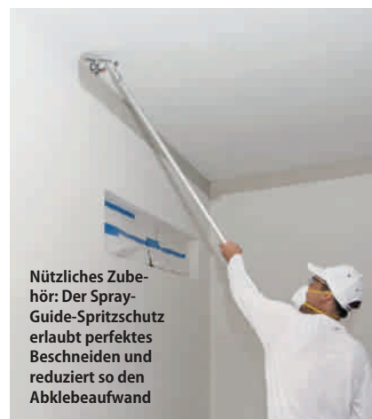
Nützliches Zubehör: Der Spray-Guide-Spritzschutz erlaubt perfektes Beschneiden und reduziert so den Abklebeaufwand

ken ist, um Kunden zeitgemäß zu bedienen. Durch den geringeren Abdeckaufwand und die schnellere Verteilung des Materials wird ein Zeitvorteil erzielt. Außerdem überzeugt das einwandfreie, gleichmäßige Finish. Positiver Nebeneffekt: Betriebe, die modernes Equipment verwenden, gelten bei den Kunden als Qualitätshandwerker und grenzen sich von der Billigkonkurrenz ab. Jürgen Linz