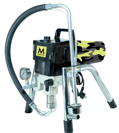
Ohne viel Schnickschnack: Kompakte, leicht zu bedienende wie die des Anbieters Monster machen den Einstieg in die Spritztechnik einfach