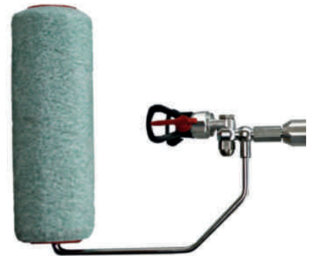
Spritzen und Rollen in einem Arbeitsgang: Der SprayRoller ist das ideale Werkzeug, um große Wandflächen rationell zu beschichten