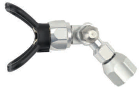
Mit einem verstellbaren Kniegelenk zwischen Verlängerung und Düsenkopf kann immer der optimale Spritzwinkel eingehalten werden